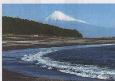
三保の松原と富士山