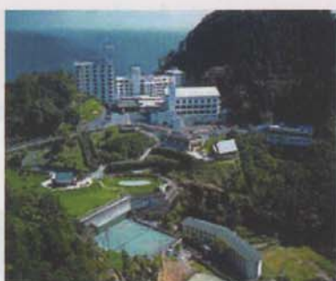
焼津グランドホテル