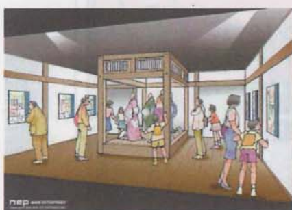
NHK大河ドラマ館「直虎」

平素は格別のご高配を賜わり厚くお礼申し上げます。さて、本年の親睦旅行は富士山を一望する遠州の名湯「焼津温泉」に決定しました。男女を問わずお楽しみ頂けるよう配慮しておりますので、皆様お誘い合わせの上、奮ってご参加くださいますようお願い申し上げます。尚、お申込みについては下記の通り郵便局から88観光宛お振込み下さい。