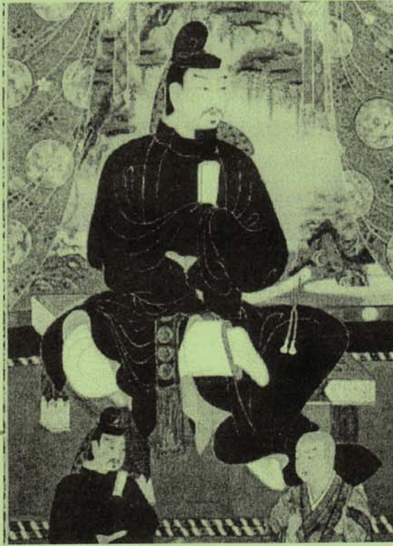
藤原鎌足像 室町時代 奈良国立博物館所蔵